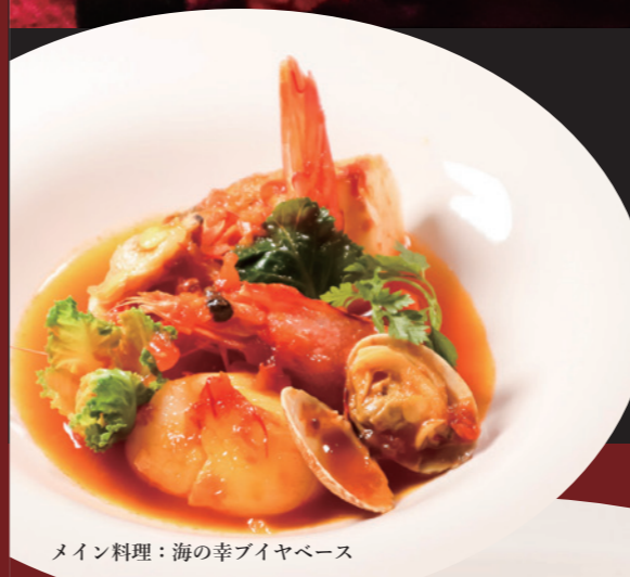
メイン料理：海の幸フイヤベース

アンピールホテル大阪では2021年『クリスマスフェア』を開催いたします。 期間限定で特別なクリスマスをお届けします。