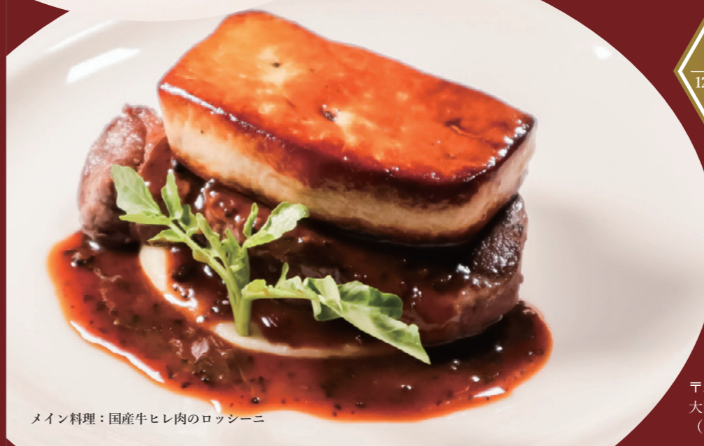
メイン料理：国産牛ヒレ肉のロッシュニ