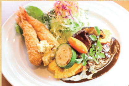
日替わりランチ+エビフライ