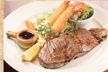
ステーキ+エビフライ