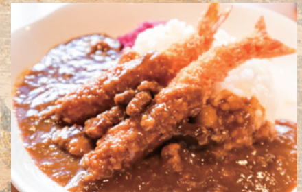
トンテキ+エビフライ