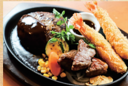
ハンバーグ (&ステーキ)+エビフライ