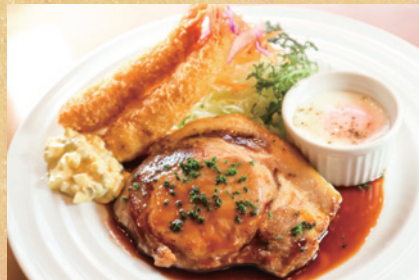
トンテキ+エビフライ