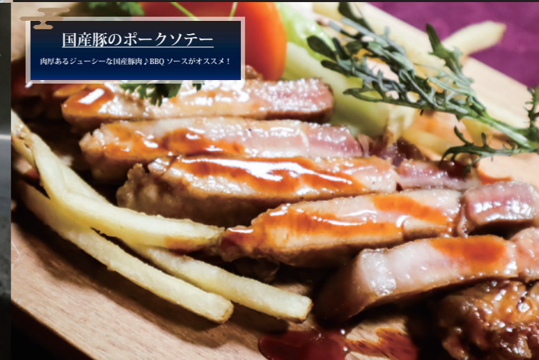
国産豚のポークソテー 肉厚あるジューシーな国産豚肉、BBQソースがオススメ!

ディナータイム：17時～21時 / 料理L.020時 最終受付：18時30分まで ※5/7(日)は夜定休