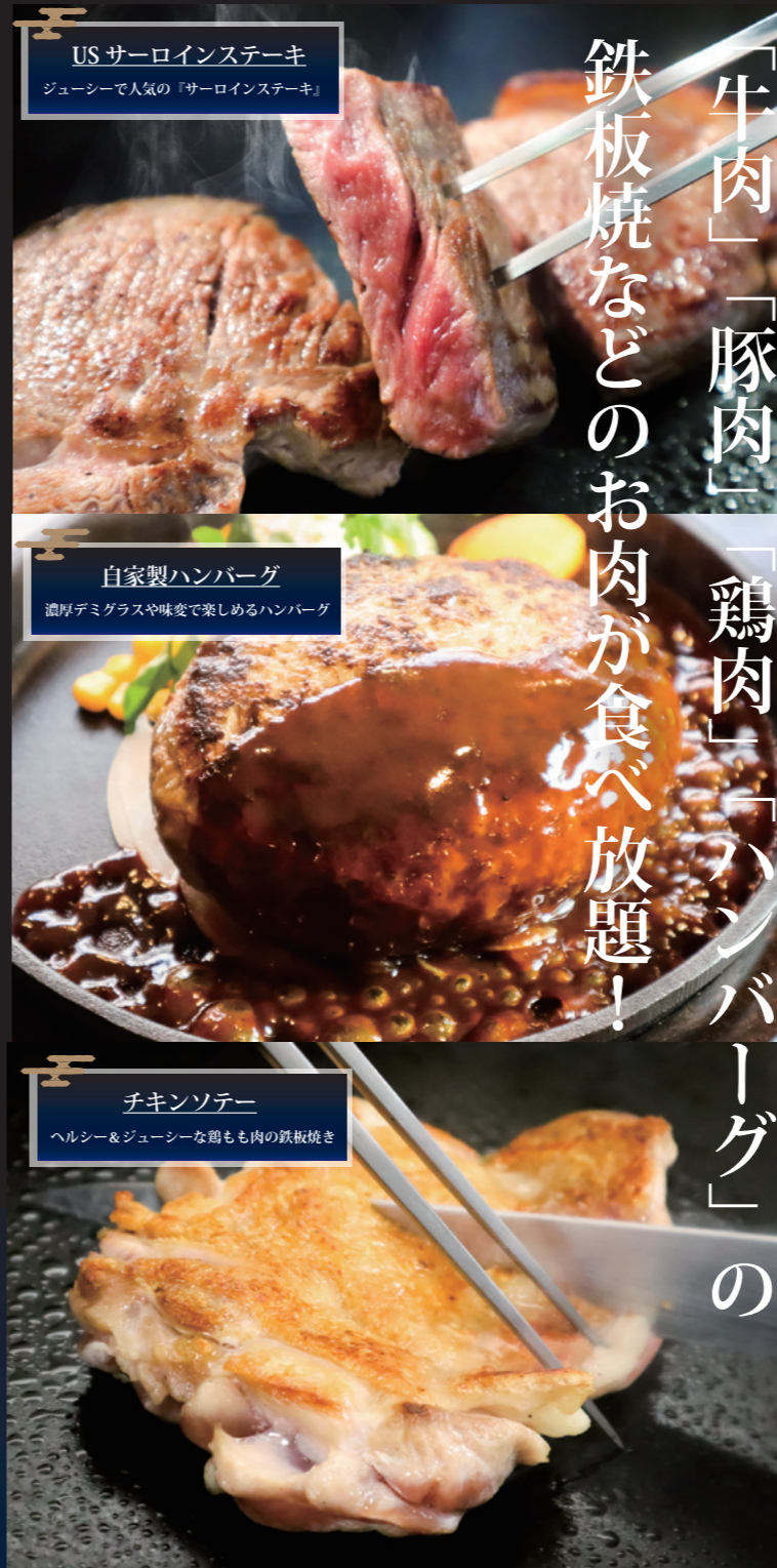
USサーロインステーキ ジューシーで人気の「サーロインステーキ」